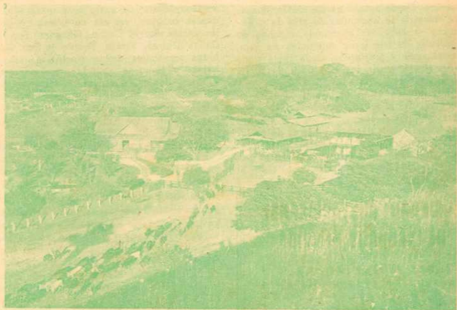
(Vista de una finca de ganado)

Se casaban con sólo una mujer, pero los grandes señores tenían varias. Se regían por